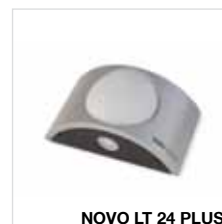
NOVO LT 24 PLUS