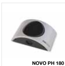
NOVO PH 180