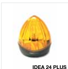
IDEA 24 PLUS